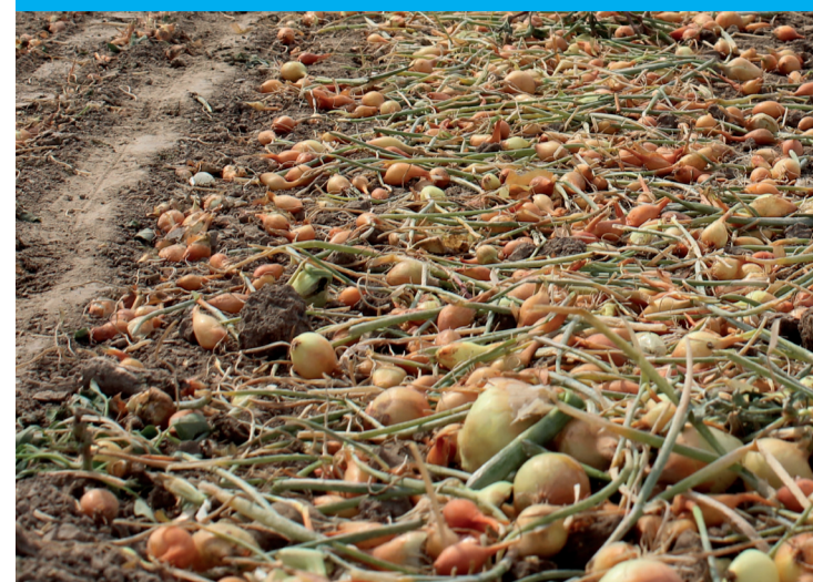
Door de droogte zijn veel uien niet volgroeid

Teus Stam waterschapsbestuurder ChristenUnie bij Waterschap Rivierenland