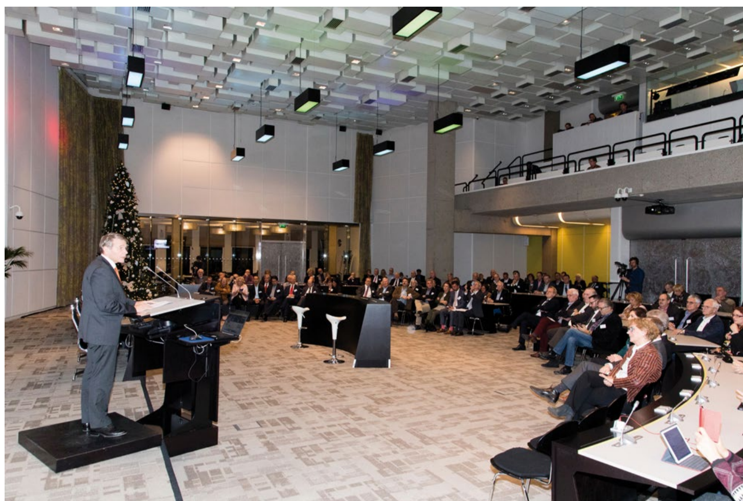
Prof. mr. J.P.H. Donner aan het woord tijdens Statenontmoeting met raadsleden