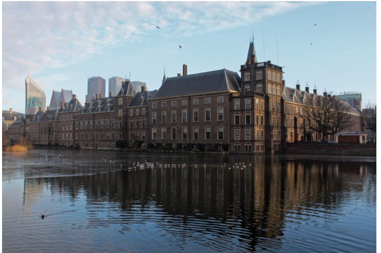
Hofvijver met gebouwen van het Binnenhof (zie pagina 4)