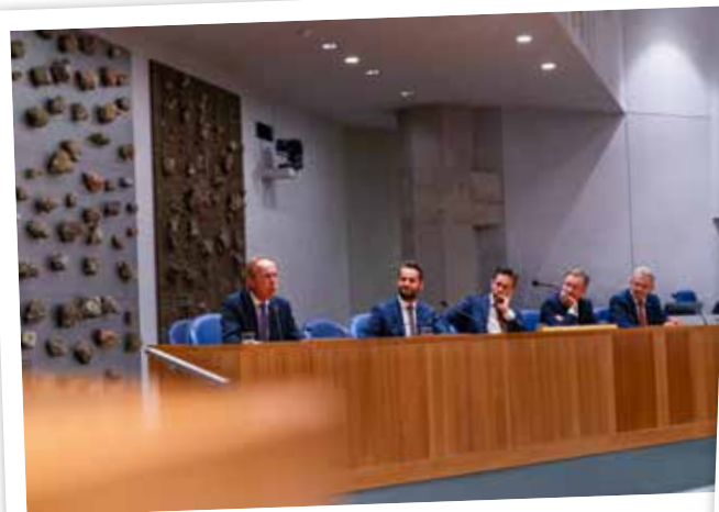
Nog even de kunst afkijken.