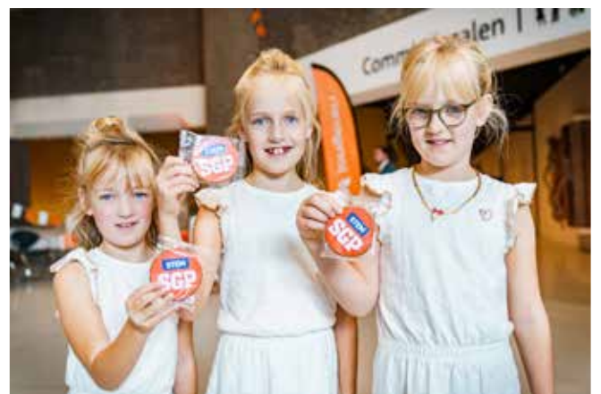
Het Kamerpersoneel krijgt meerdere partijen over de vloer met hun open dagen, maar wat opvalt bij de SGP: "Wat zijn hier veel kinderen bij, zeg! Het wordt ze met de paplepel ingegeven."