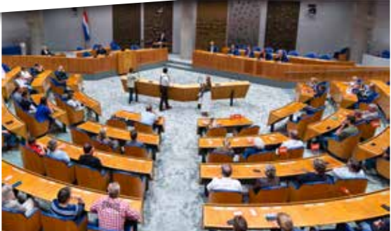
Bij het vragenvuur moesten de microfoons soms diep buigen, maar ondanks de kritische vragen zijn onze (kandidaat-) Kamerleden niet afgevoerd als aangeschoten wild.