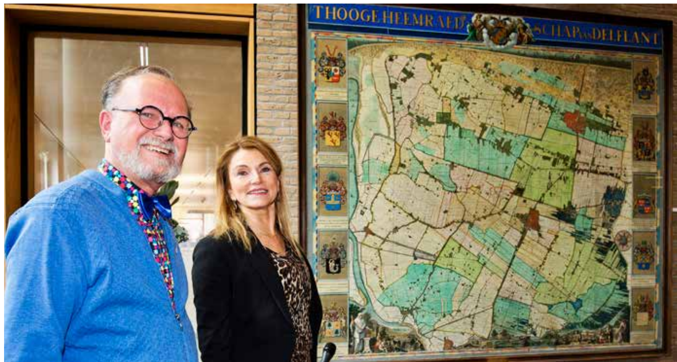
Delfland onthult Kruikiuskaart

Onlangs is door het algemeen bestuur van Delfland de Watervisie voor de regio vastgesteld. Het cultuurhistorisch erfgoed is één van de dragers voor de realisatie van de watervraagstukken. De inbreng van bewoners met betrekking tot de geschiedenis van de streek is een niet onbelangrijk aspect voor de oplossing van watervraagstukken. Het grootste karwei moet nog plaatsvinden. We moeten het poldermozaïek van Delfland niet alleen conserveren maar ook consumeren. Erop of eronder, cultureel watererfgoed is de spil voor waterstaatszorg.